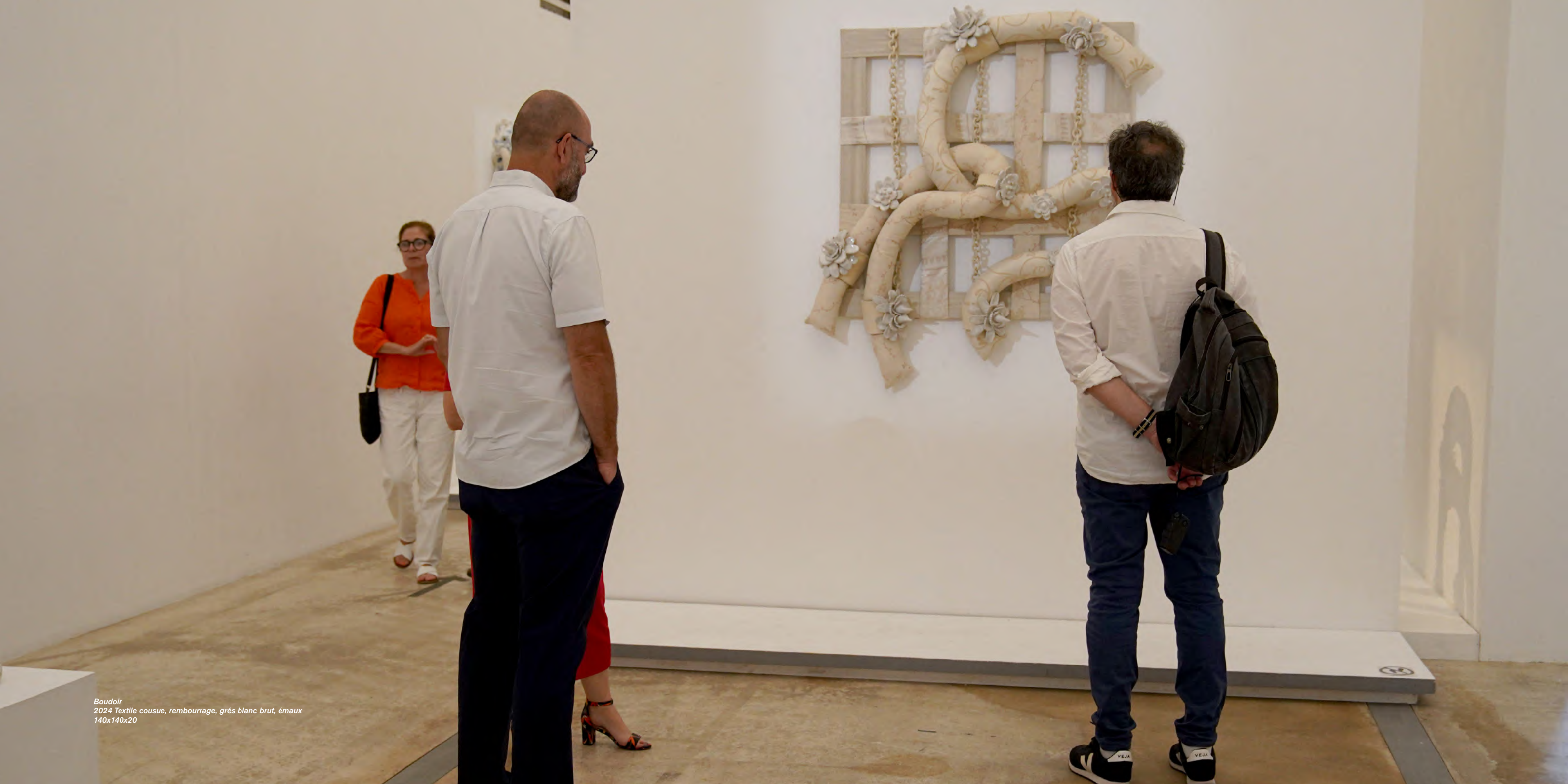
Boudoir 2024 Textile cousue, rembourrage, grés blanc brut, émaux 140x140x20