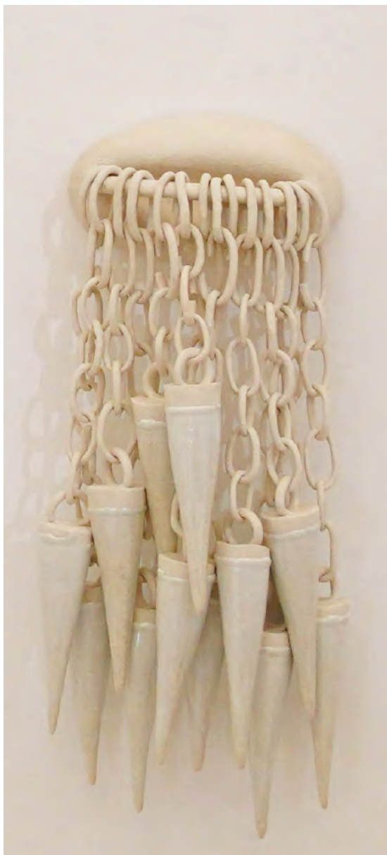
14 talons aiguilles 2015 grés, porcelaine, Émaux