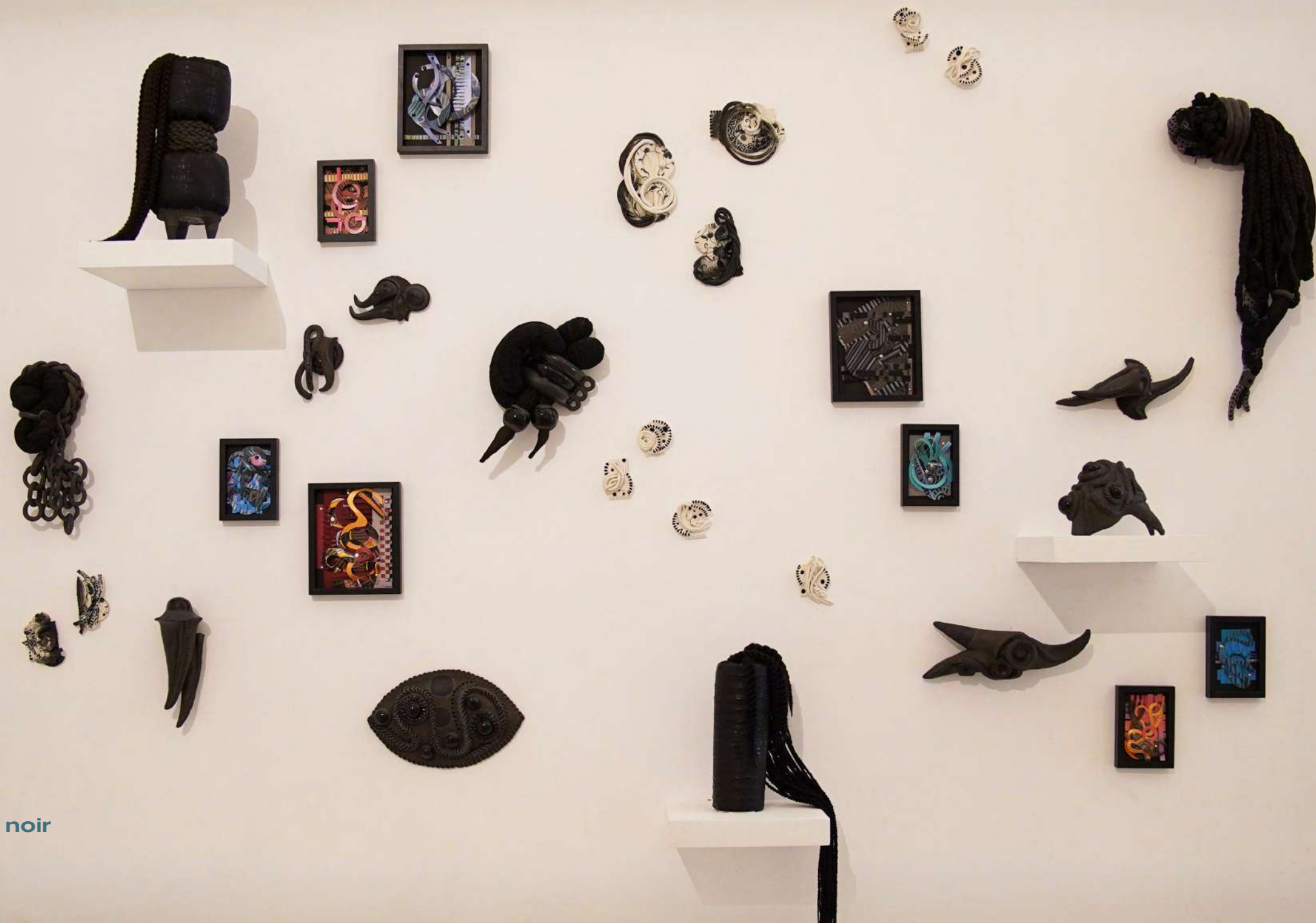
Cabinet de curiosité noir