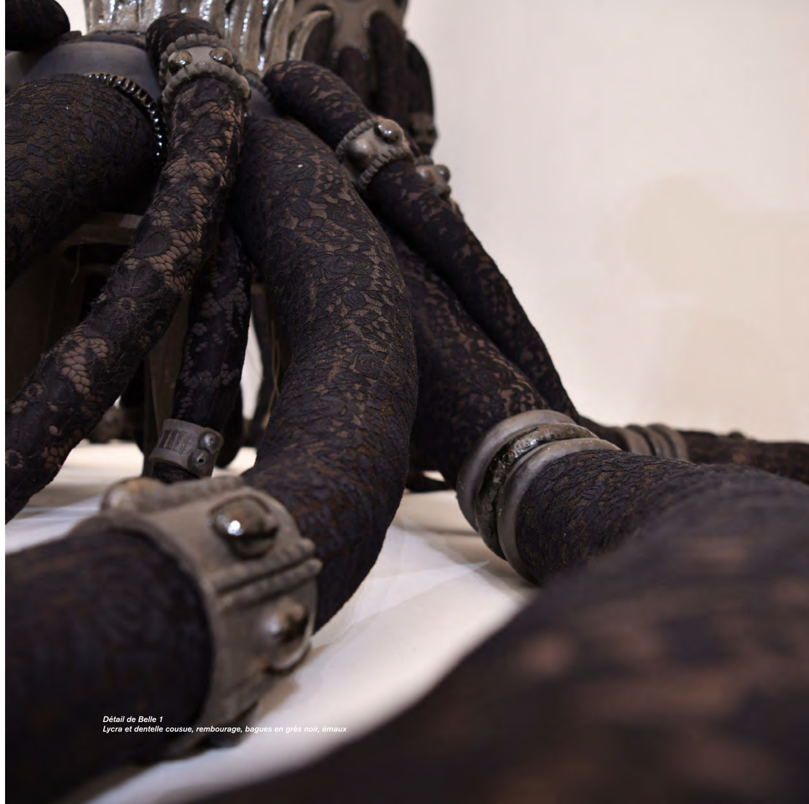
Détail de Belle 1 Lycra et dentelle cousue, rembourrage, bagues en grés noir, émaux