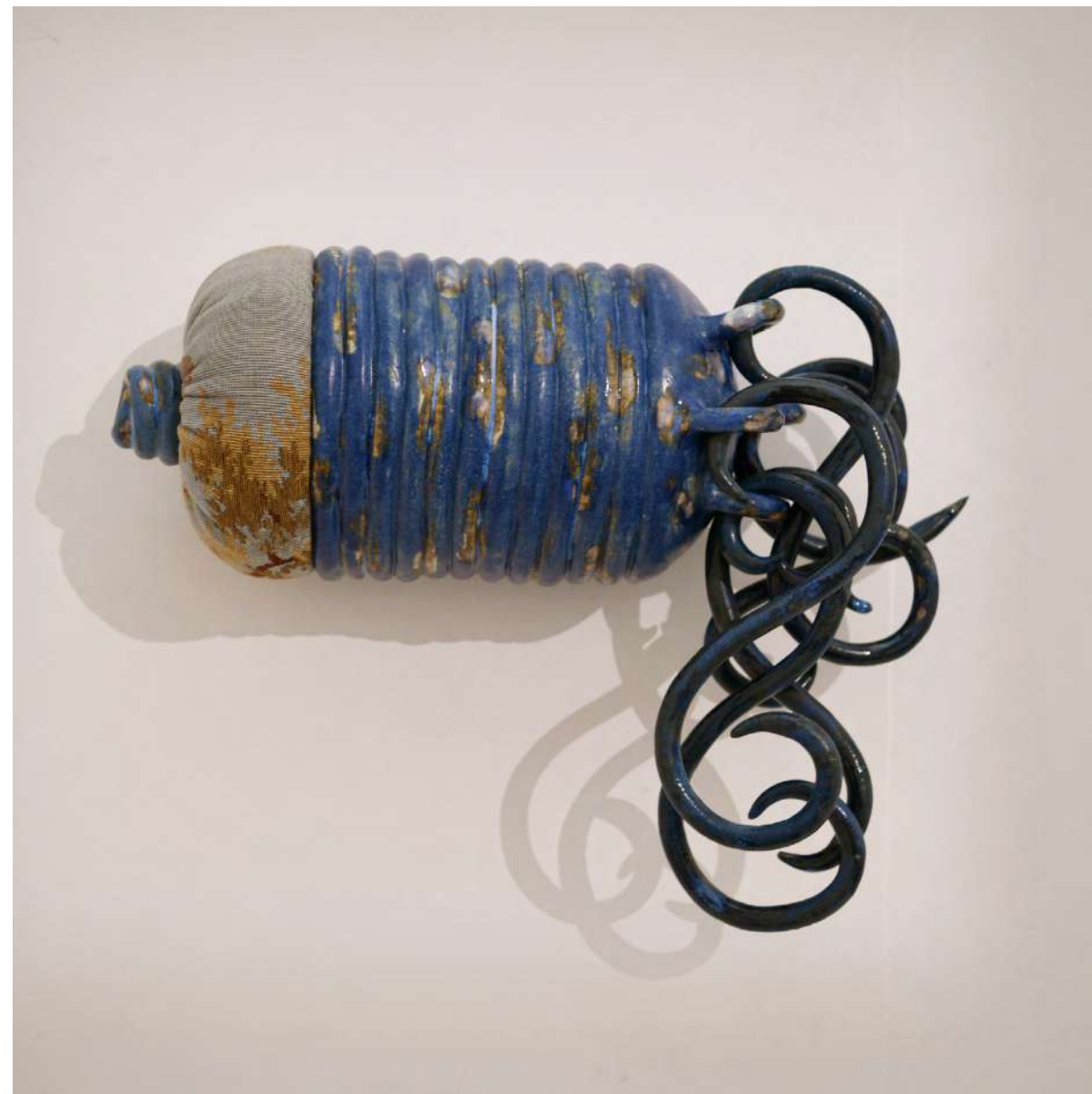
Paysage bouclé 2 2021 grès émaillé, tappiserie cousue, rembourrage 5x43x17