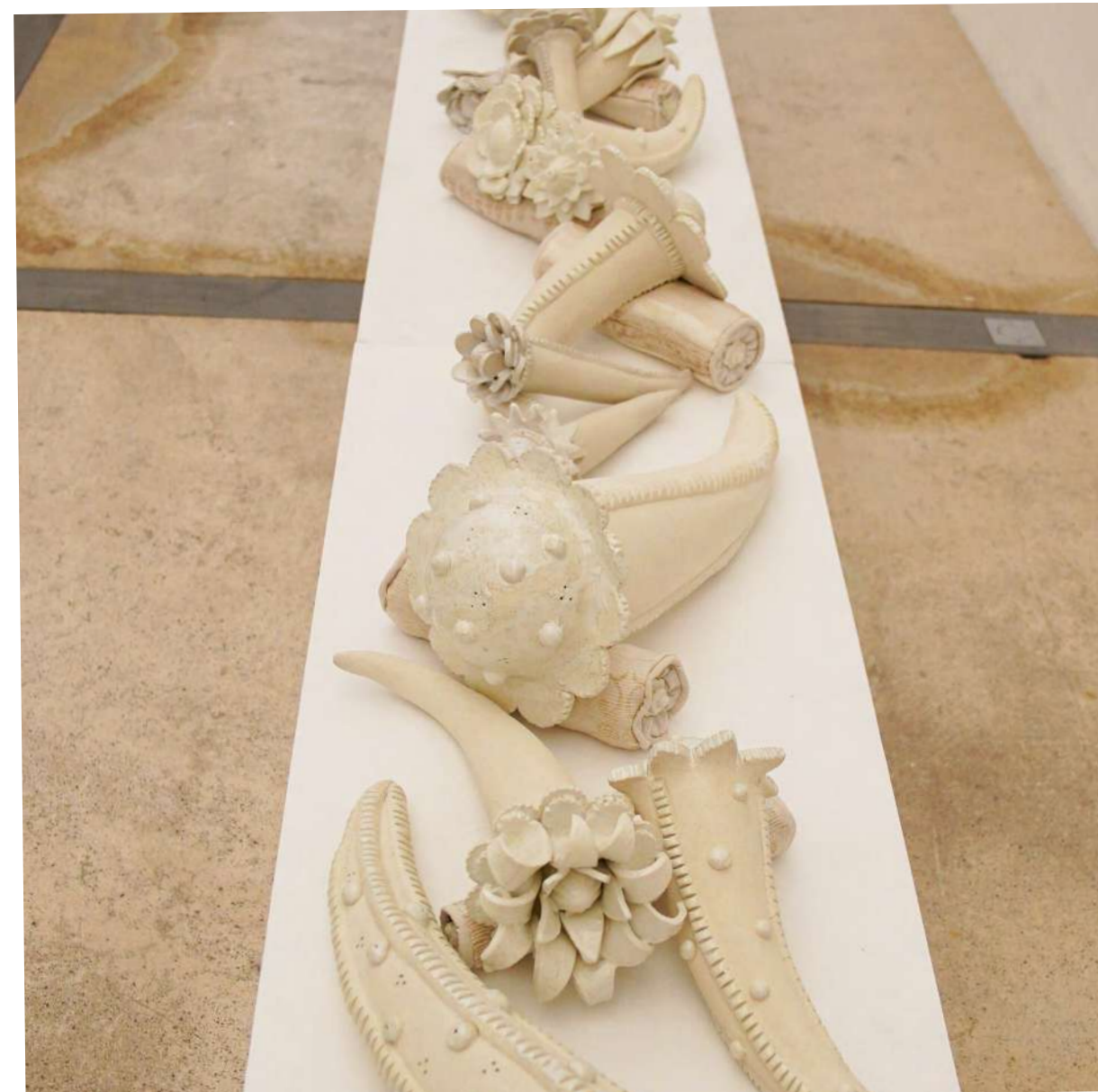
Les endormies 2024 21 pièces Grés porcelainique, émaux, mini pochons en textile 450x50 cm