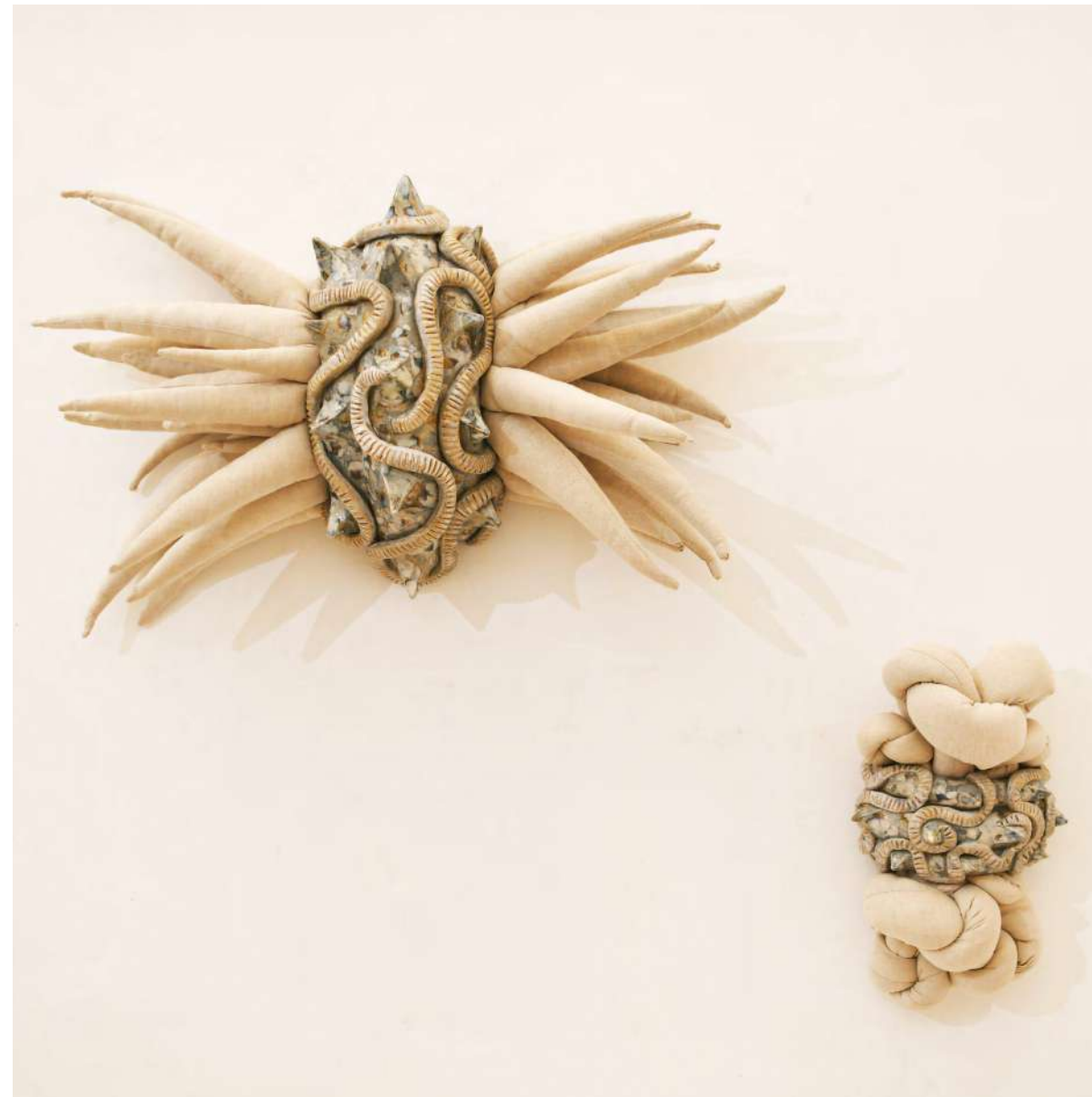
Mercredi 2 avril 2014 grès émaillé, toile métis cousue, rembourrage 90x80x28 cm