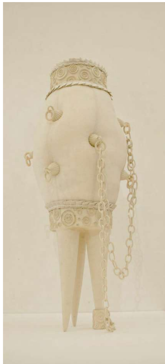
Lundi 11 avril 2016 grés, porcelaine, Émaux, textile cousue