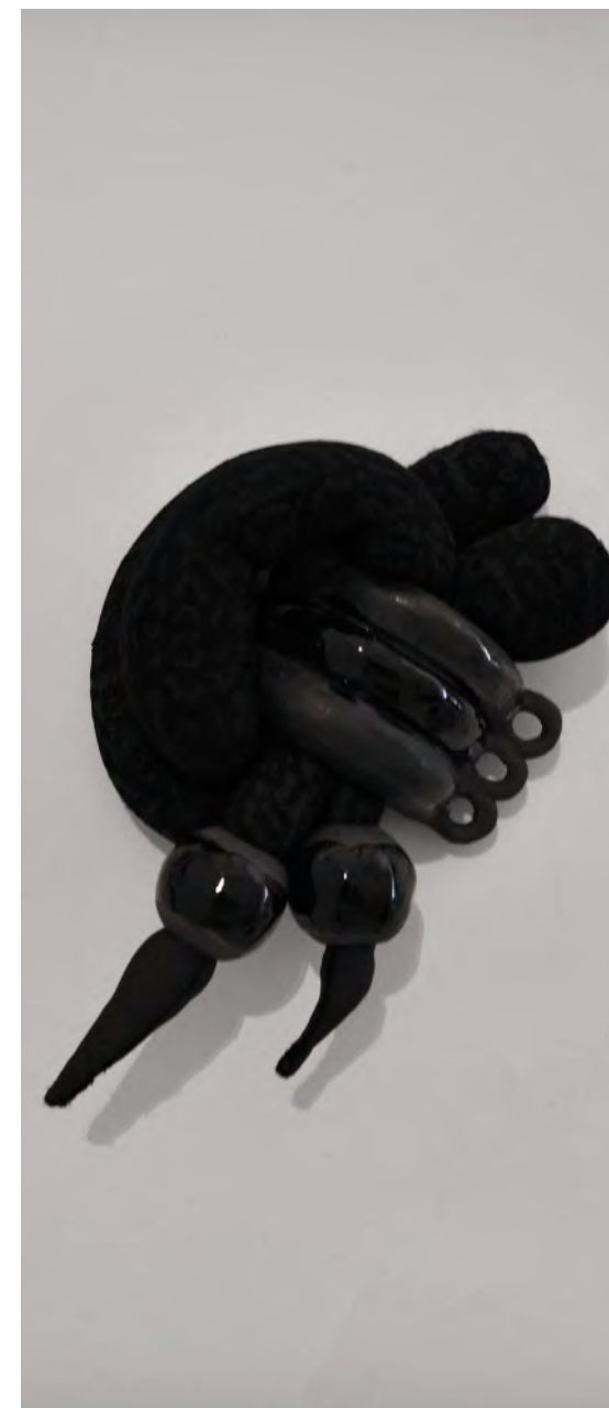
2 bijoux, 3 anneaux 2020 grès noir, émaille, lycra, dentelles, rembourrage 38x23x20 cm