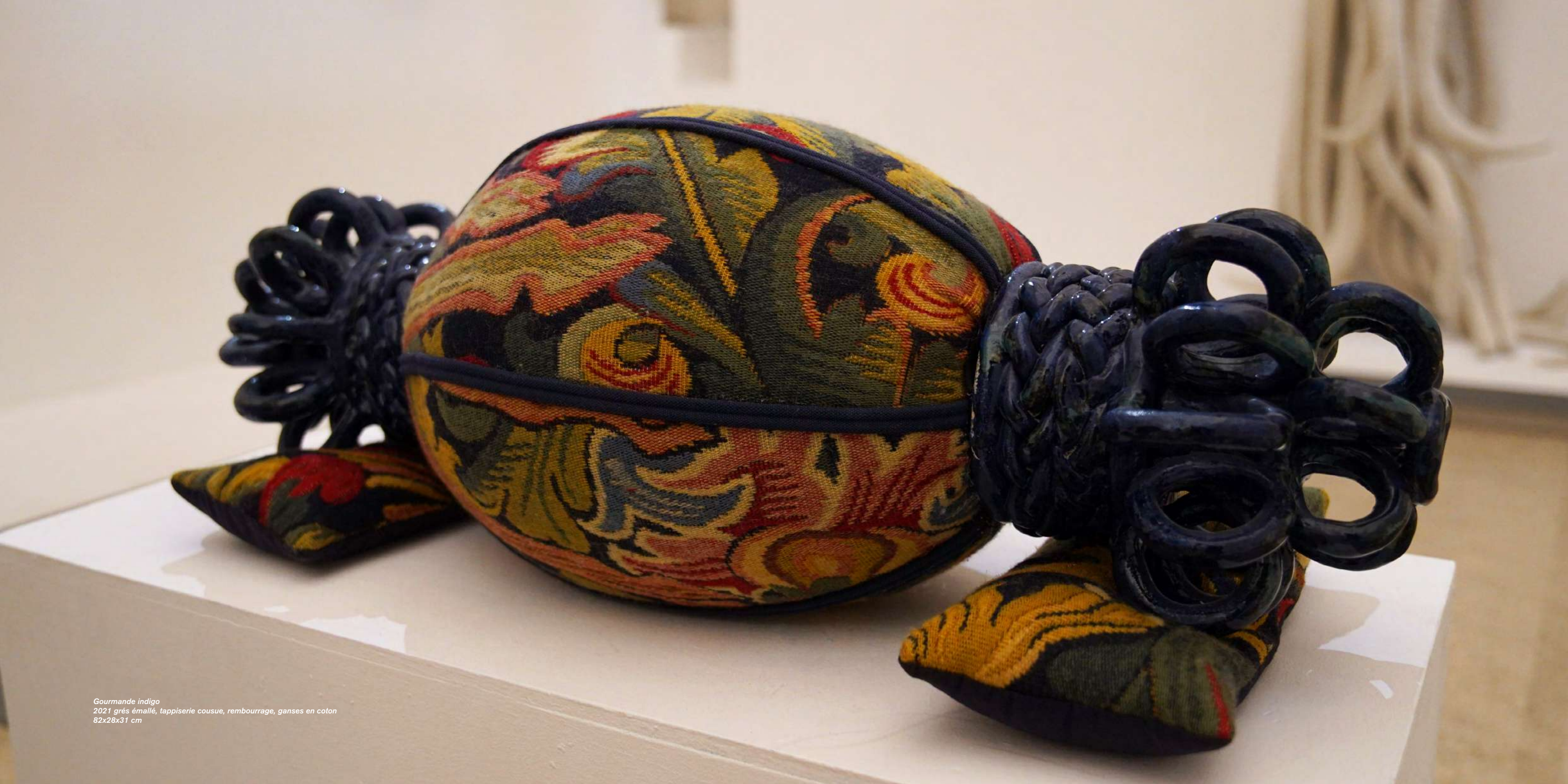
Gourmande indigo 2021 grés émailé, tapisserie cousue, rembourrage, ganses en coton 82x28x31 cm