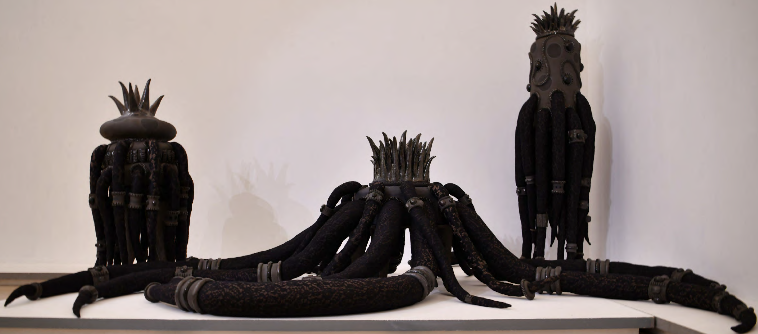
Trois Belles grés noir, émaux, tissu, dentelle, rembourrage Belle 1 2017 400x350x85 cm Belle 2 2018 70x70x130 cm Belle3 2018 60x70x210 cm