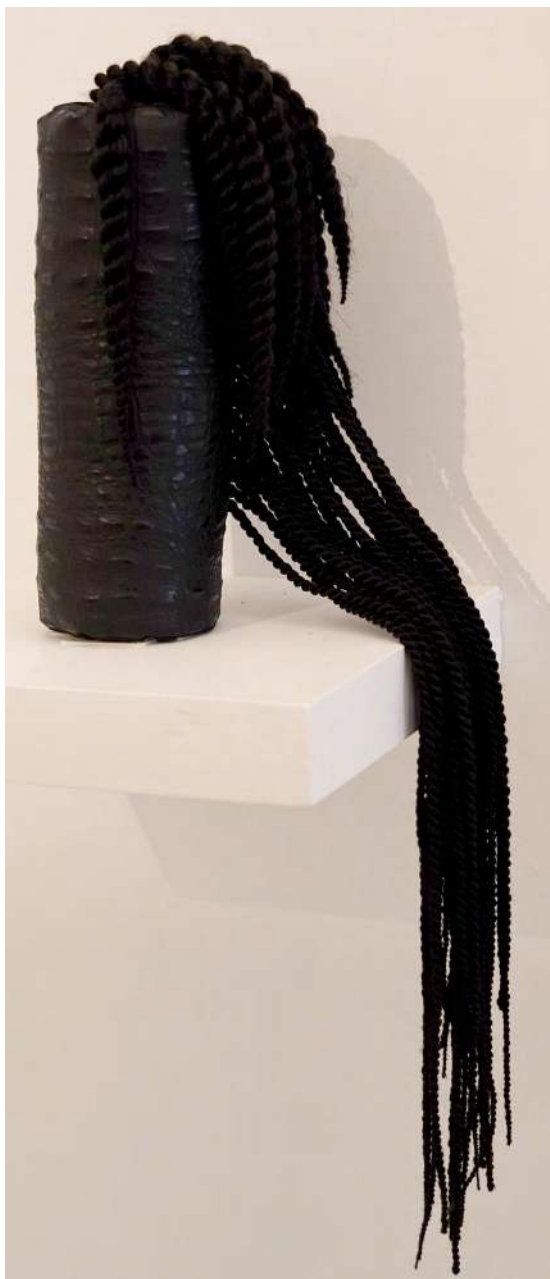
Sensuelle du mercredi 5décembre 2018 Cuir synthétique cousu, rembourré, cheveux synthétiques