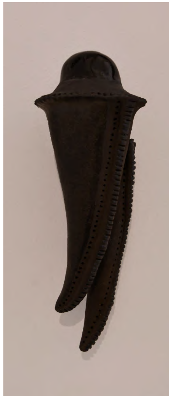
Glissade 3 2022 grès noir, émaux, engobe 9x26x8 cm