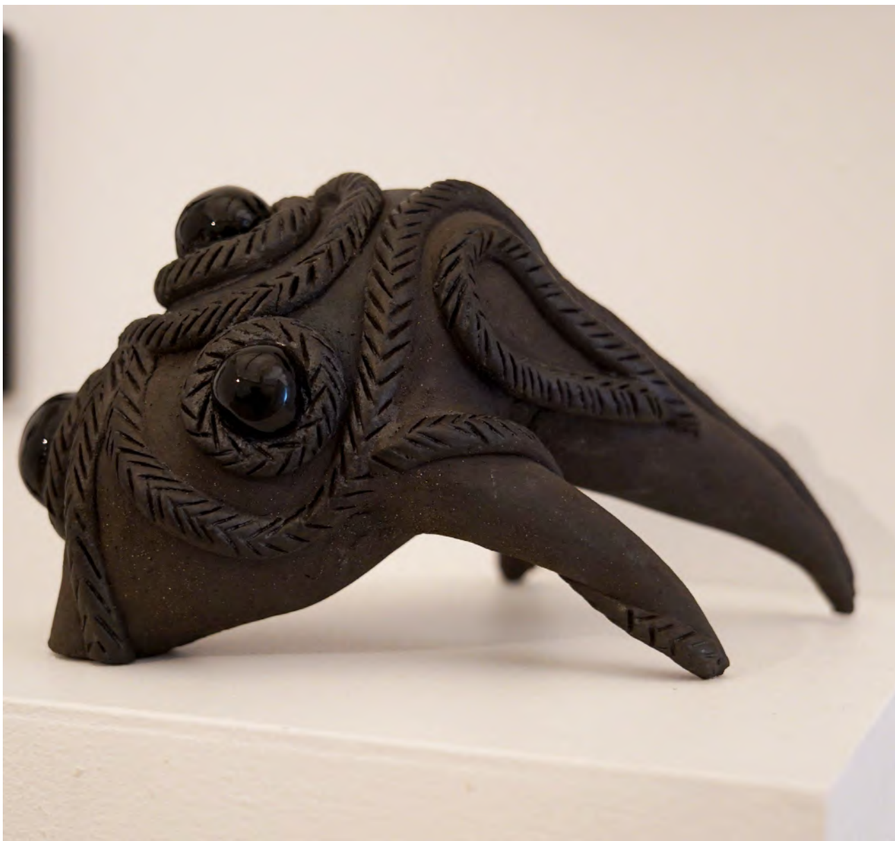
Noir 2022, grés noir, émaux 30X20X18 cm