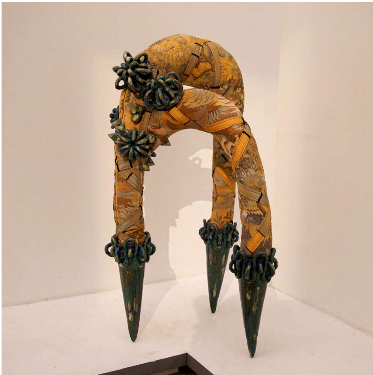
Les ferrêts d'iris 2021 grès émaillé, tappiserie cousue, rembourrage, tissu 60x60x116 cm