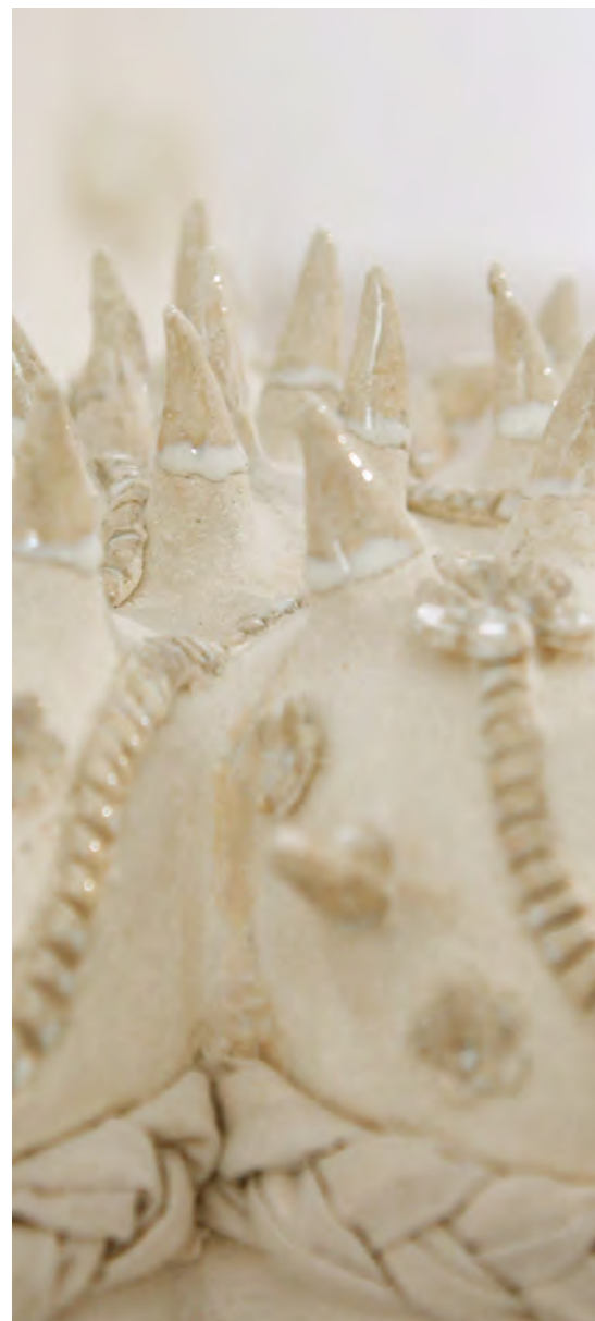
Détails de jeudi 7 avril 2016 grés, porcelaine, Émaux, textile cousue, rembourrage