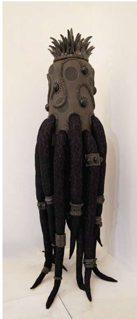
Belle 3 2018 grès noir, émaux tissus dentelles et rembourrage 60x70x210 cm