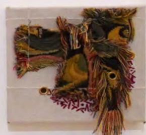
Série petite chute 2021 Tapisserie, velours, ganse œillets métallique, broderie, coton piqué sur toile de lin tendue sur châssis, grès émaillé 20x20x7 cm