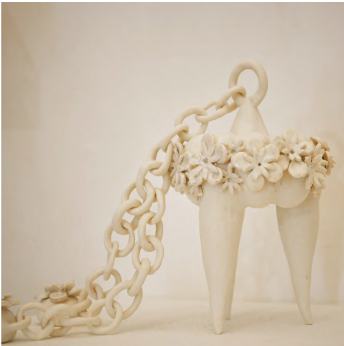
Sculpture aux patins 2016 porcelaine, Émaux