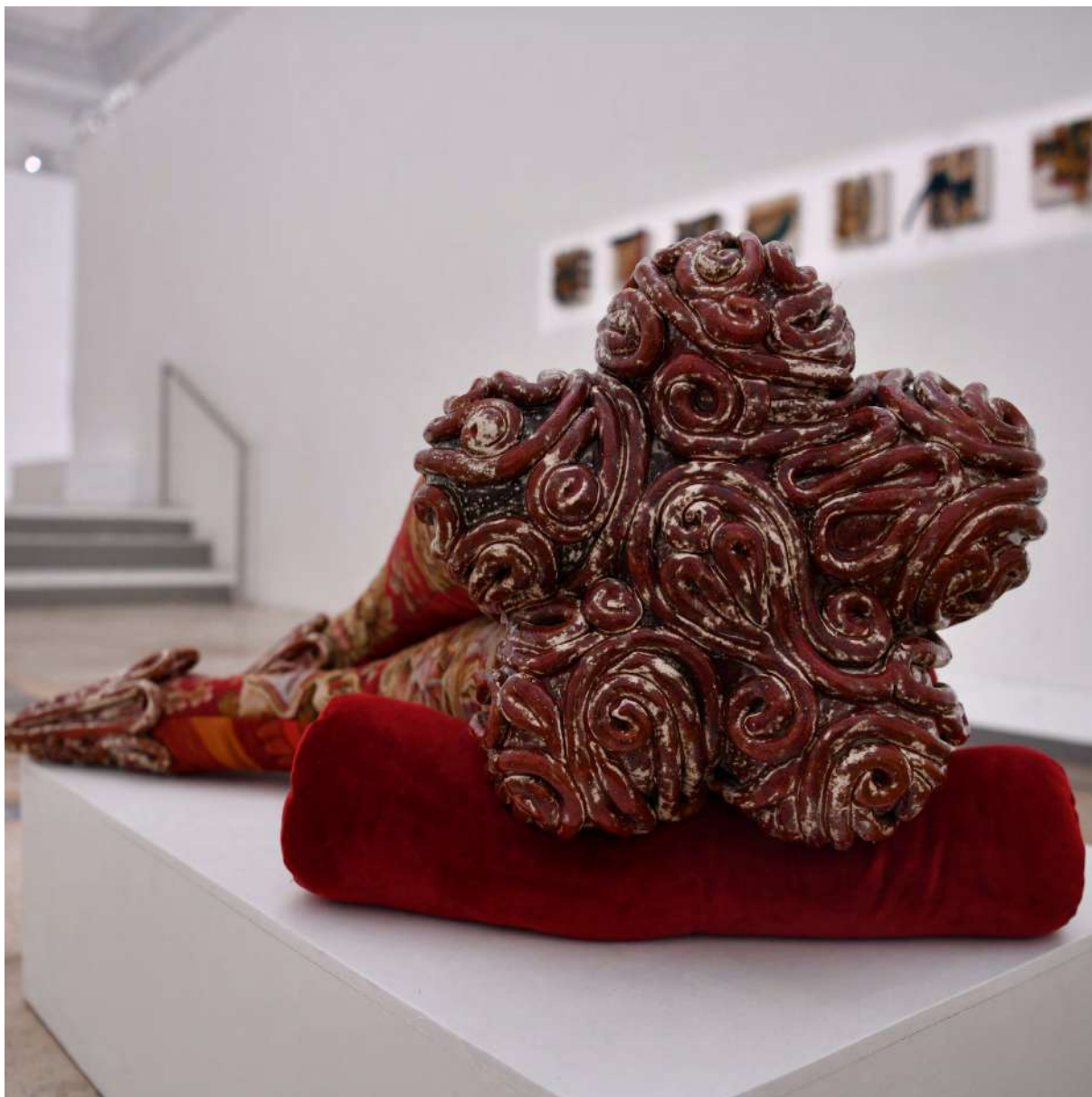
Rouge brûlée allanguie 2021 grès émaillé, tapisserie cousue, rembourrage, tissu et velours 94x58x45 cm