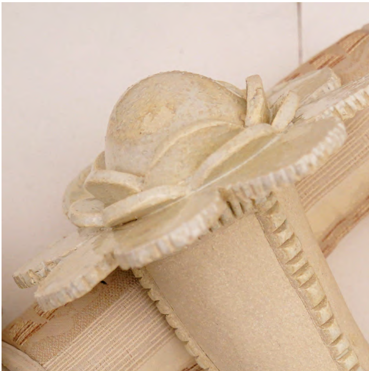
Détail des Endormies 2024 grés porcelainique, émaux, mini pochons en textile