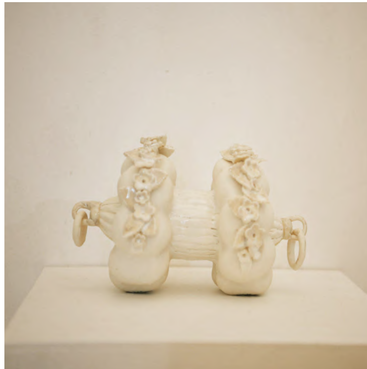
Fleurs et anneaux 2016 porcelaine, Émaux 21x14x12 cm